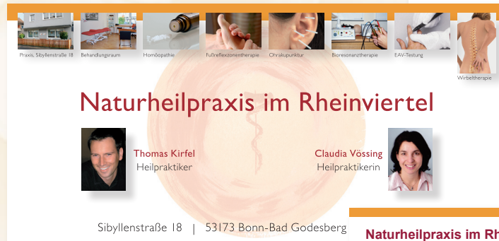
Praxisinformation (Rückseite ohne Abbildung)